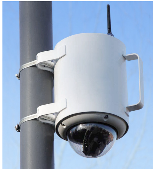
Publicam – die vandalensichere und drahtlose Tag- und Nachtkamera